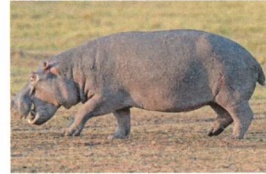
das Nilpferd: 2 300 kg