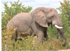
der Elefant: 4 t 800kg