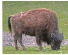
der Bison: 1 050 kg