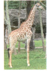
die Giraffe: 800kg