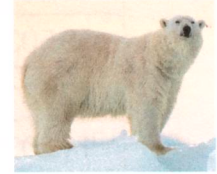
der Eisbär: 450kg