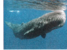
der Pottwal: 39 t