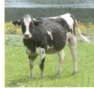
die Kuh: 720kg