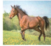
das Pferd: 1 t 100kg